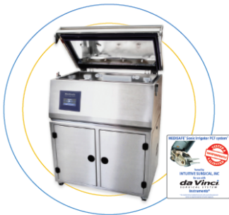
SI PCF 'S' - Aufbereitungslösung für robotische Instrumente